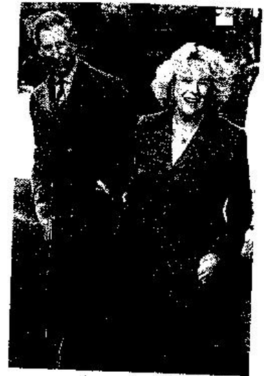
Carlos y Camila, una pareja polémica

... tida sobre su futuro matrimonio. Y también la prensa británica informaba de que el príncipe Carlos de Inglaterra y su prometida recurren estos días a una terapia alternativa japonesa llamada reiki para poder afrontar la tensión del momento. ●